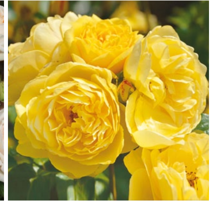
Académie d'Orléans® (Eveflor - André Eve)