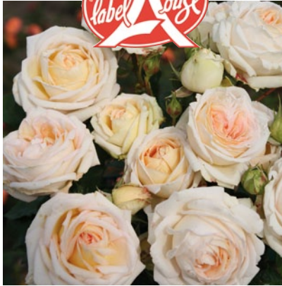
Madame Anisette® (Korberonem - Kordes / Globe Planter)