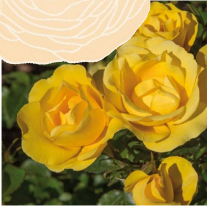
Rayon de Soleil® (Meyanacid - Meilland International)